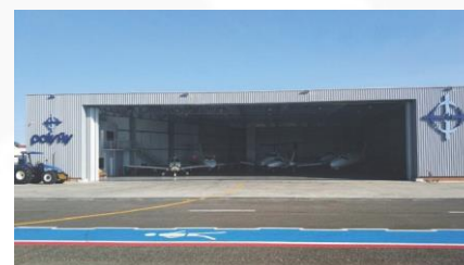
Navegantes, SC – Brazil Hangar PolyFly