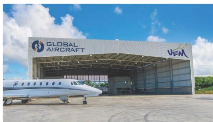
Salvador, BA – Brazil Hangar Vem Aviation