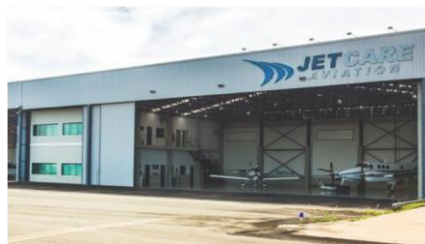
Sorocaba, SP – Brazil Hangar Jetcare Aviation