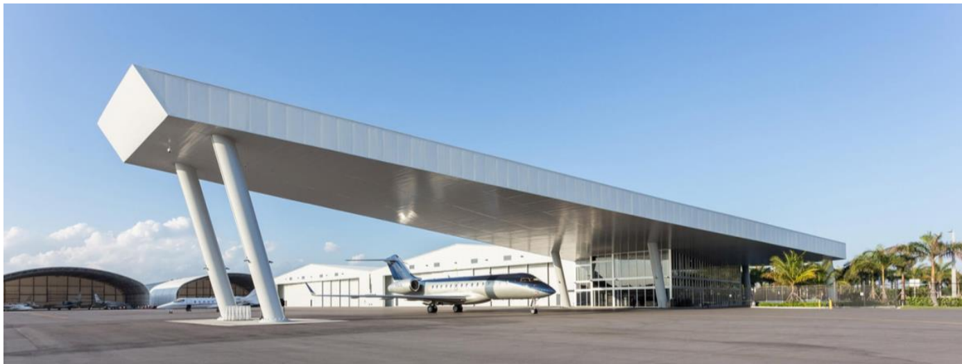
Headquarters: Fontainebleau Aviation, Miami-Opa locka Executive Airport, FL - USA